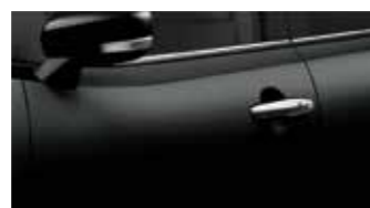
Midnight Black Pearl (ZAM)