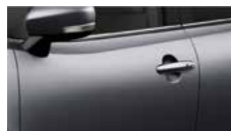
Glistening Gray Metallic (ZNZ)