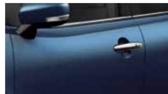
Ray Blue Pearl Metallic (Z9Q)