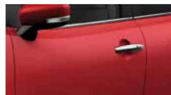
Fire Red (Z4Q)