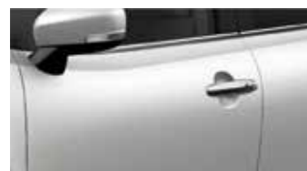
Arctic White Pearl (ZHJ)