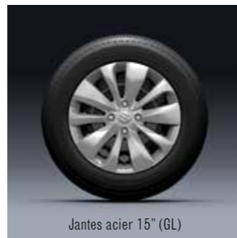
Jantes acier 15" (GL)