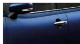
Urban Blue Pearl (ZQT)