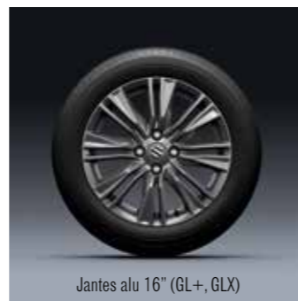
Jantes alu 16" (GL+, GLX)