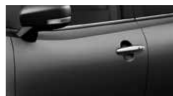
Granite Gray Metallic (ZTN)