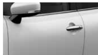
Superior White (26U)