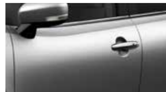
Premium Silver Metallic 3 (ZQS)